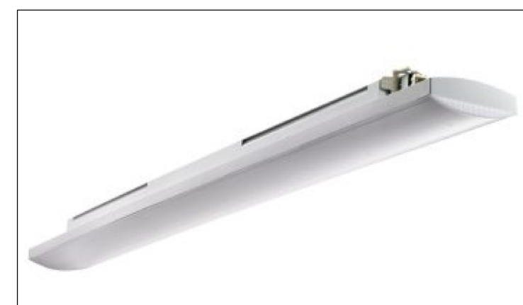
PLAFONIERA A LED SPOGLIATOI