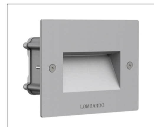
SEGNAPASSO A LED