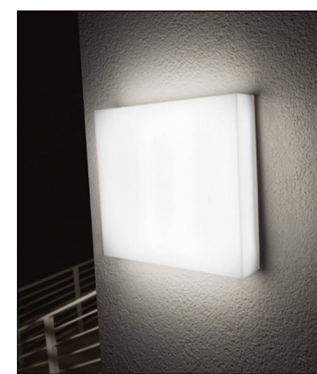
PLAFONIERA A LED PER ESTERNO