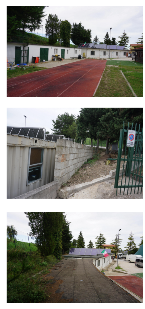
VOLUME EDIFICIO SPOGLIATOI ESISTENTI - da demolire - 1:200